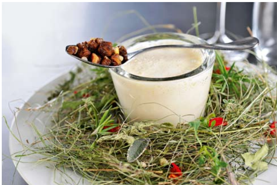
Die vom Bundesrat angedachte Qualitätsstrategie basiert auf den guten Beziehungen zwischen den lokalen Produzenten und Produzentinnen und den Abnehmern. Im Bild: Die Qualitätsstrategie genussvoll umgesetzt. Berghesuspe im Hotel Schweizerhof, Lenzerheide.

Die Schweizer Landwirtschaft produziert Kalorien auf historischer Rekordhöhe. Die Menge ist somit nicht das Problem, die Wertschöpfung und die Nachhaltigkeit der Produktion hingegen sehr wohl. Eine Qualitätsstrategie soll nun auf Basis von gemeinsamen Werten das Problem angehen und gleichzeitig Land- und Ernährungswirtschaft näher zusammenrücken lassen.